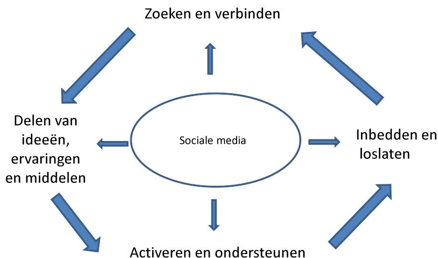
Afbeelding 2. Schema nieuwe beleidscyclus

We lichten de vier fasen van deze cyclus van sturen op sociaal kapitaal hieronder toe.